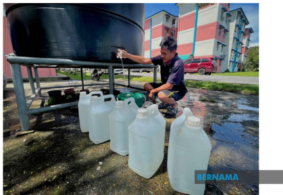
Gangguan bekalan air sejak 6 bulan, penduduk mohon tindakan penyelesaian