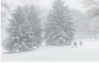
AS: Lebih 5,500 penerbangan dibatalkan susulan ribut salji