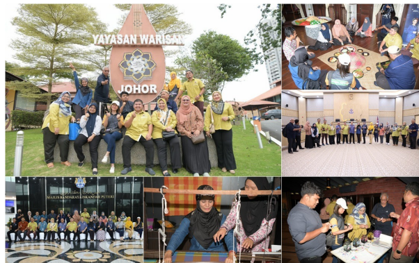
LADA tumpu usaha bangunkan pelancongan budaya Langkawi tahun depan