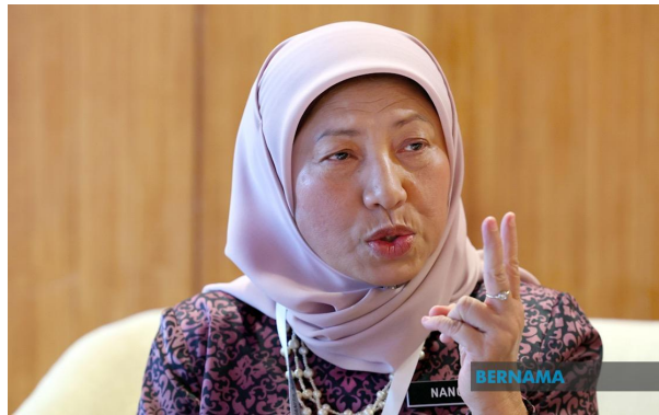
Rakyat Malaysia diingat agar tidak lupa tragedi Batang Kali, mangsa banjir ketika rai Krismas